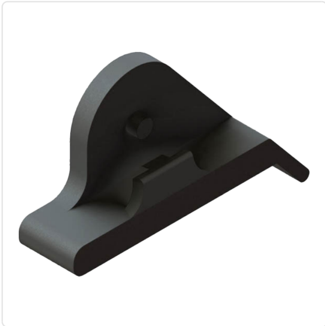
Abbildung ggf. ähnlich

Breite [mm]: 7.9 Brennbarkeitsklasse: UL94-V2 Farbe: schwarz Länge [mm]: 28.6 Material: PA 6.6 Materialgruppe: Kunststoff Gewicht: 1.21g Konformitäten: