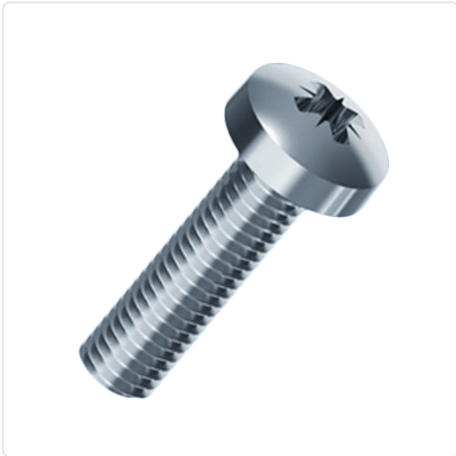
Abbildung ggf. ähnlich