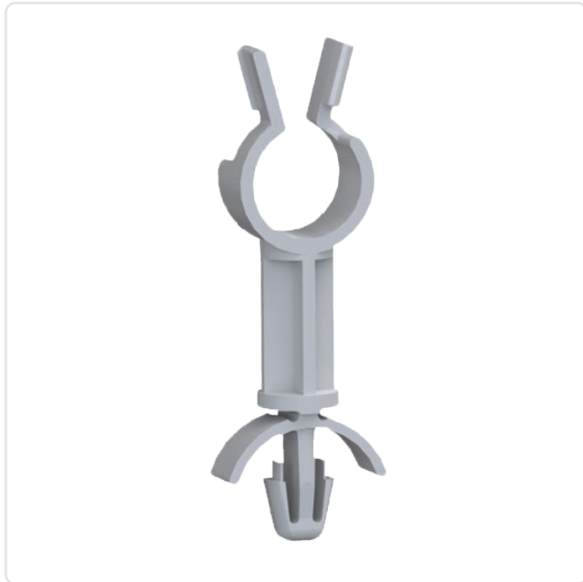
Abbildung ggf. ähnlich