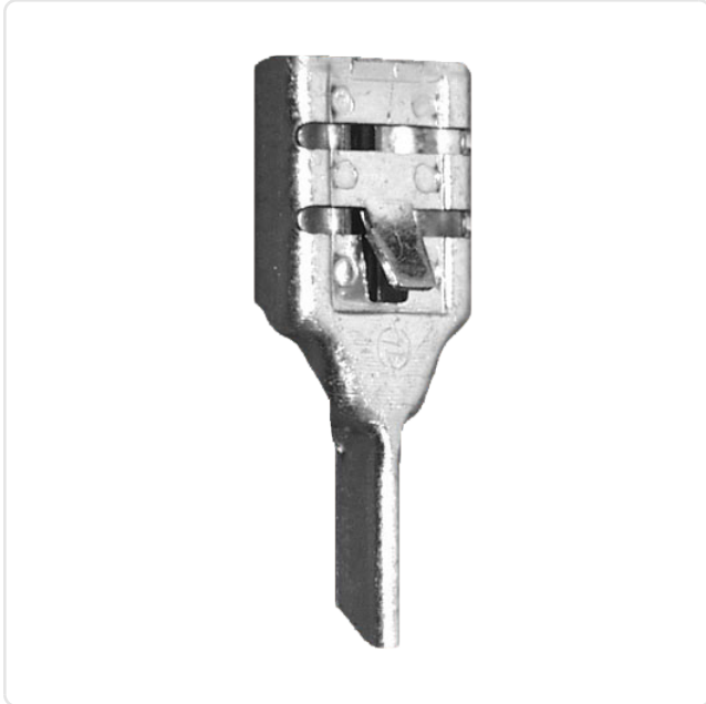
Abbildung ggf. ähnlich

DIN/ISO: DIN46247 Länge [mm]: 18 Material: Bronze Materialgruppe: Bronze Oberfläche: verzinkt Steckgröße [mm]: 6,3x0,8 Gewicht: 0.5g Konformitäten: