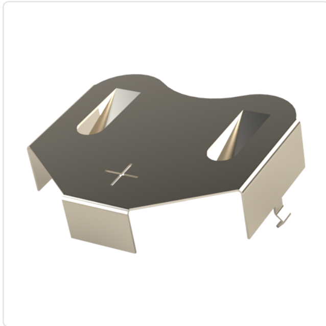
Abbildung ggf. ähnlich

Anzahl Zellen: 1 Batterietyp: Knopfzelle 12mm Bautyp: Anschluss Leiterplattenmontage Höhe [mm]: 3 Material: Phosphorbronze Oberfläche: vernickelt 3µm E1E Zellendurchmesser [mm]: Ø 12,0 Gewicht: 0.4g Konformitäten: