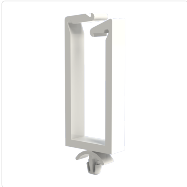
Abbildung ggf. ähnlich