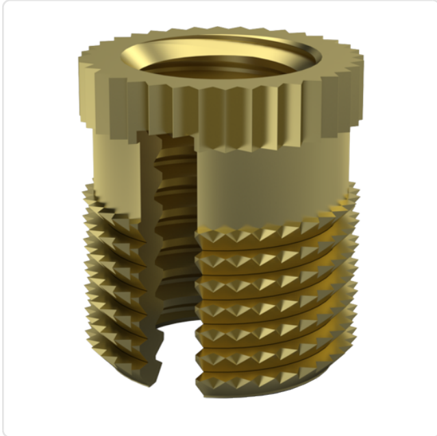
Abbildung ggf. ähnlich

Bohrung Montageplatte [mm]: 4 Gewindegröße: M3 Länge [mm]: 6.5 Material: Messing Materialgruppe: Messing Oberfläche: blank Gewicht: 0.29g Konformitäten: