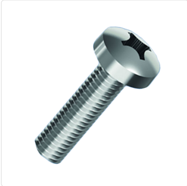
Abbildung ggf. ähnlich