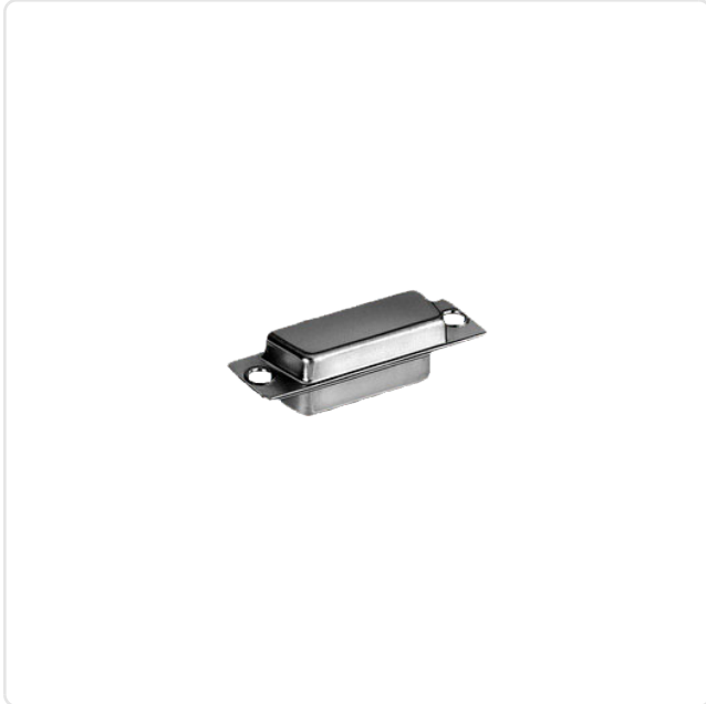
Abbildung ggf. ähnlich

Bautyp: D-Sub Breite [mm]: 30.8 Material: Stahl Materialgruppe: Stahl Montagebohrung [mm]: 3.2 Gewicht: 3.1g Konformitäten: